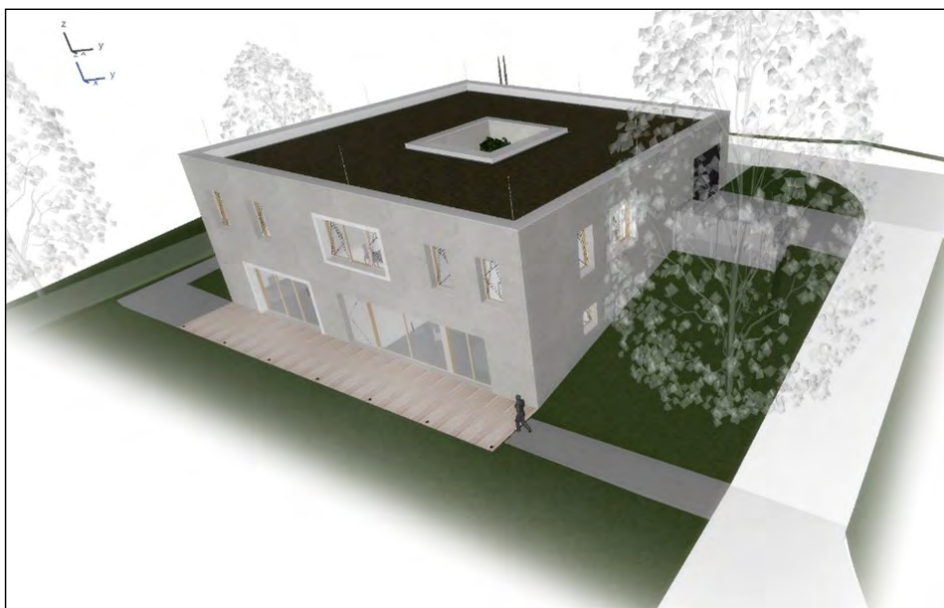
Vizualizace - pohled JV ze školní zahrady

rum, ale i prostory pro archiv obce, sklad a technické zázemí. Nespornou výhodou umístění Centra je jeho přímá návaznost