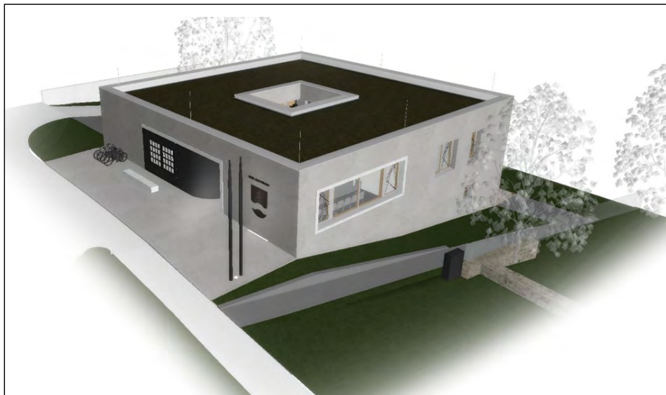
Vizualizace - pohled SZ z komunikace (parkoviště)

Není žádným tajemstvím, že obec Chocerady se dlouhodobě potýká s nedostatkem budov ve svém vlastnictví a s tím souvisejícím nedostatkem prostor pro provoz obcí zřízených či podporovaných subjektů. Rozhodně máme takových objektů méně, než bychom si představovali a než bychom potřebovali.